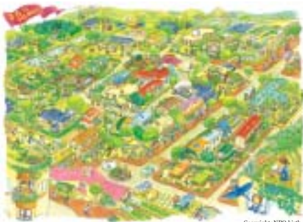
公園や雑木林、農園、街路樹、校庭など、暮らしの中にはたくさんの緑がある。この緑を、市民・行政・企業のパートナーシップで守り育む活動をコーディネートするのがNPO birthだ。

現在、birthは東京都を活動の拠点としていますが、東京には海や川があり、都市があり、丘陵がある。世界中から見ても、水と緑が豊かな恵まれたロケーションです。せつかく世界に向けてメッセージを発信している都市なので、世界から注目されるような都市にしたい。都民、人ひとりが意識を高め、「地みどり」を育て、みんなが笑顔で暮らす。そうやって、世界の人々とつながりを広げていきたいと思っています。人も自然も、東京にはそれだけの潜在力がありますからね。birthは小さなNPOですが、「つながり」を広げていくコーディネートはできます。地球規模の「地みどり」を育てていくことが私の大きな夢です。