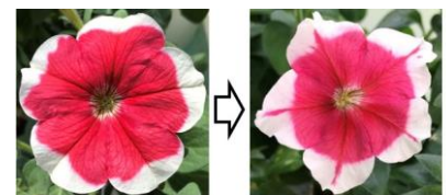
図 3 覆輪系統 (ハカラ・ローズピコティー) の花 (左) と老化した植物に出現した花 (右)

今後の展開： 今回報告したペチュニアと PVCV の関係は、内在ウイルスの活性化を花の色 (模様) の変化でビビットに捉えることのできる実験系であり、宿主植物とウイルスの攻防を研究するための優れた研究材料といえます。また、PVCV のように植物のゲノムに内在し普段は増殖しないウイルス (パラレトロウイルス) は、ペチュニアだけでなくダイズやトマトなど多くの作物やダリアなどの花卉のゲノムに普遍的に存在することが知られています。これまで知られていなかった、内在ウイルスの活性化により植物の性質が変わるしくみを明らかにした本成果により、今後、作物や花の安定生産や、内在ウイルスを利用して花の色や模様を自由に変えられるような新品種の開発が期待されます。